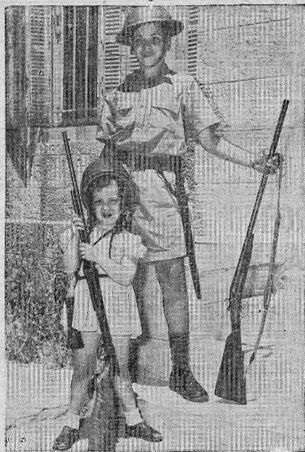
JUGANDO A LA GUERRA — Imitando a sus padres y hermanos grandes, estos dos niños judíos se visten de soldados para jugar a la guerra, durante la actual tregua en la Tierra Santa.