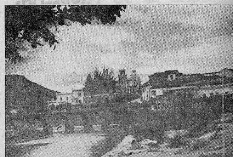
Un aspecto del puente Mayol de Tegucigalpa

Ha llegado a nuestra mesa de redacción el último número de la "Guía Oficial de Centro América", que dirige en esta capital don Enrique de la Flor. Se trata de una publicación sumamente útil, la cual es solicitada desde los Estados Unidos, Europa y Sud América, puesto que contiene nutrida e importante información sobre diversos aspectos de las cinco Repúblicas centroamericanas. El esfuerzo que hace el señor de la Flor para sostener esta publicación es digno de aplauso. Con entusiasmo y energía, recaba datos sobre las más diversas actividades en las cinco Repúblicas, presentando el panorama integral del Istmo.